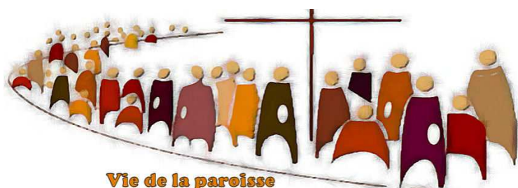
Vie de la paroisse