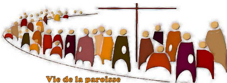
Vie de la paroisse